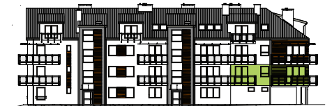
Elewacja wejściowa - wschodnia