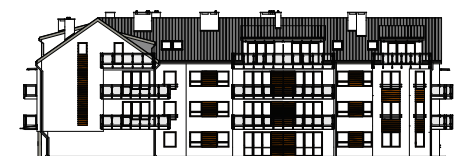
Elewacja tylna - zachodnia